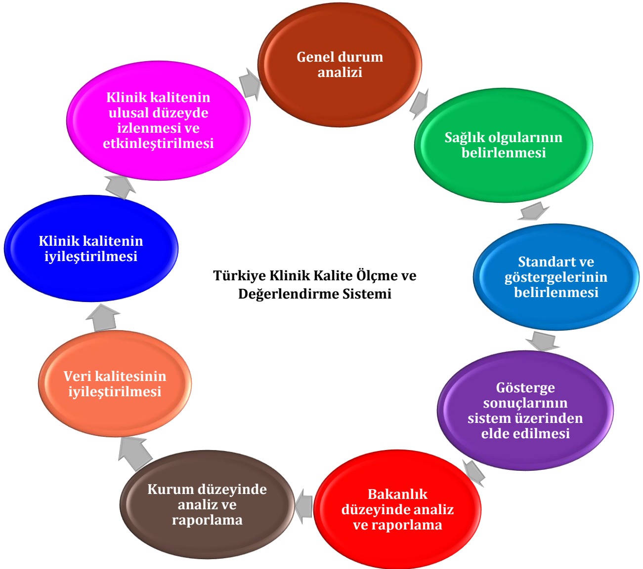
Şekil 1: Türkiye Klinik Kalite Ölçme ve Değerlendirme Sistemi ile İlgili Süreçler

Türkiye Klinik Kalite Ölçme ve Değerlendirme Sistemi ile ilgili süreçler Şekil 1’de tanımlanmıştır.